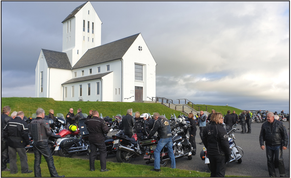
Mótorhjólaklúbbur í opinberri heimsókn