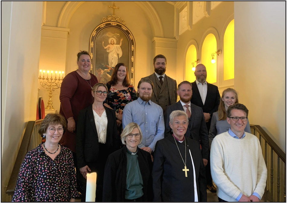
Frá útskrift starfsþjálfunar prestsefna í Dómkirkjunni.

Starfsþjálfunin sem fer fram á ábyrgð biskups var í svipuðu fari og fyrr. Skilyrði til að komast í starfsþjálfun fyrir prestsefni er að hafa lokið BA prófi frá GTD og vera byrjuð í mag.theol. námi. Djáknaefni í BA námi þurfa að vera búin með 1 ár (60e) en þau sem eru í viðbótar-diplómanámi er heimilt að byrja strax í upphafi námsins við HÍ.