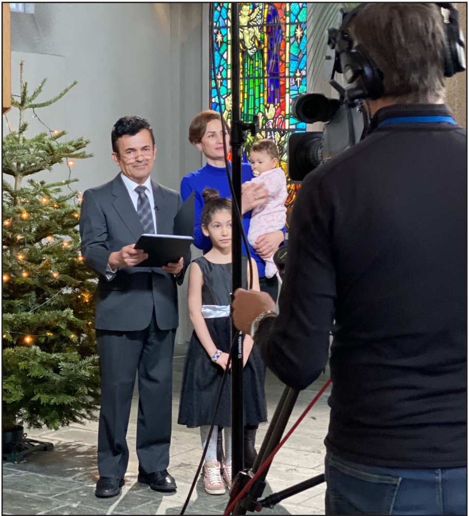
Þátttaka flóttamannafjölskyldu í jólahelgihaldi hjá RÚV

„Seekers“ samkoman í Háteigskirkju getur einnig verið tengd við sálgæsluþjónustu fyrir hælisleitendur. Stefnt er að því að vinna að undirbúningi fyrir þeirri þjónustu eftir næstu áramót.