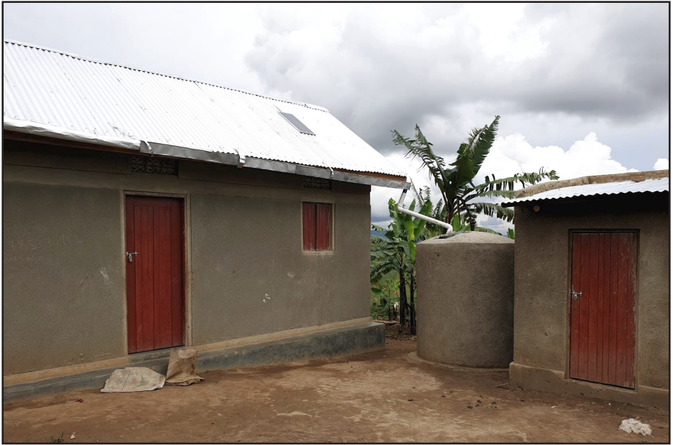
Hús, vatnstankur og eldaskáli í Úganda.

Þá er alþjóðlegt Hjálparstarf kirkna unnið í náninni samvinnu við hjálparstofnanir Sameinuðu þjóðanna og eftir ströngustu stöðlum um faglegt hjálparstarf.