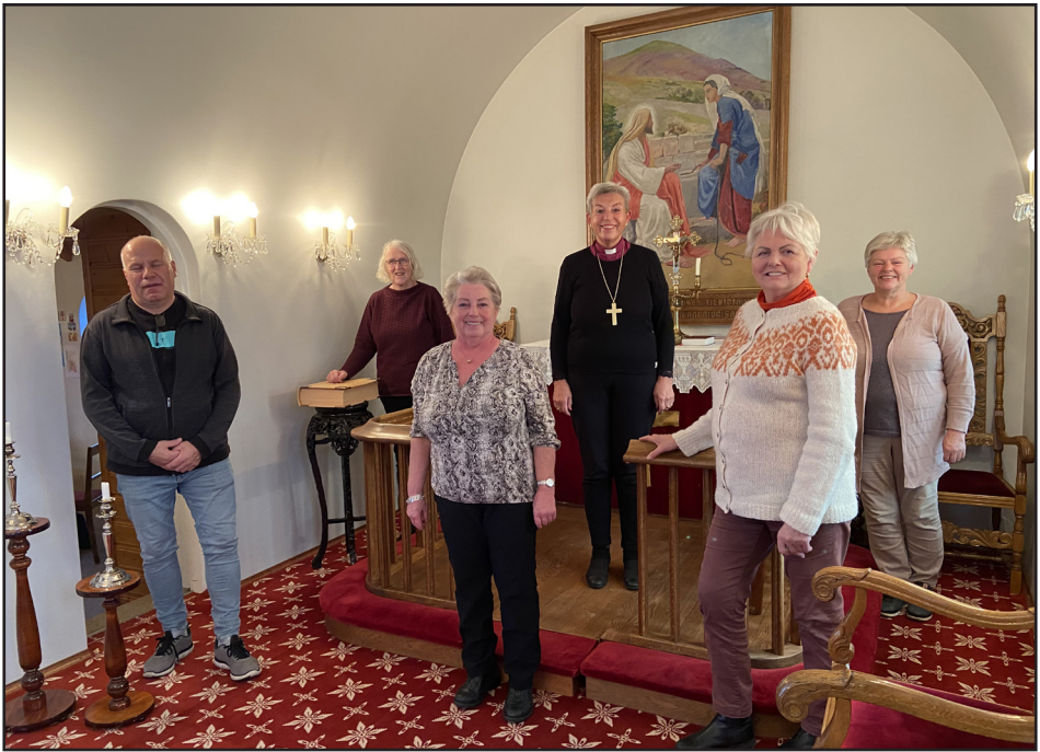
Visitasia í Svalbarðskirkju

Í þriðja lagi höldum við eina ráðstefnu á ári. Nú er nýhafin ráðstefnuröð sem tekur á brennandi málefnum í samfélaginu. Vorið 2019 var haldin ráðstefnan: Kvíðinn í samfélaginu. Á næsta ári er stefnt að því að halda ráðstefnu með yfirskriftinni Réttlætið í samfélaginu .