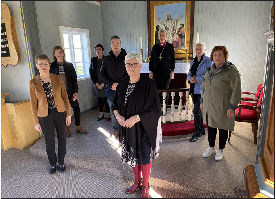
Visitasia í Grenivíkurkirkju