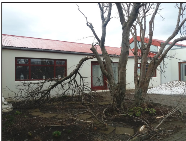
Gömlu reynitrén fóru ákaflega illa