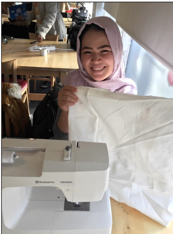
Saumaverkefni á Íslandi – Töskur með tilgang.