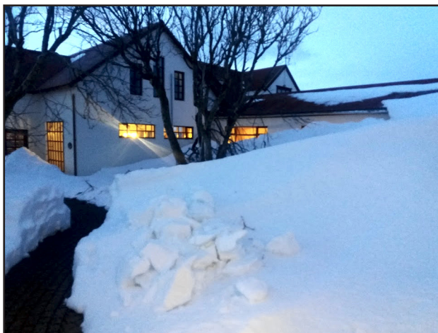
Ófært um aðalinnganginn