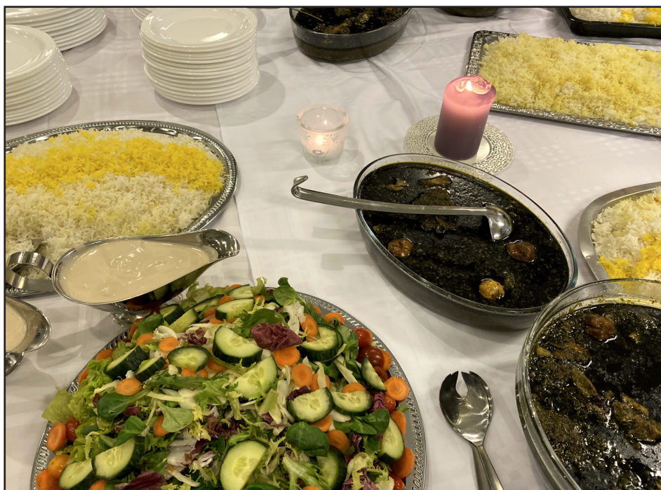
Matarboð á félagskvöldi – íranskur matur eldaður af flóttafólki

sameiginleg samkoma fyrir ICB, Seekers í Háteigskirkju og jafnvel nokkra einstaklinga sem voru staddir erlendis vegna brottvísunar.