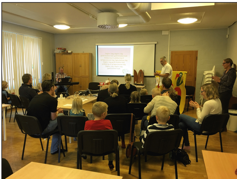
Fjölskyldusamvera í Gautaborg