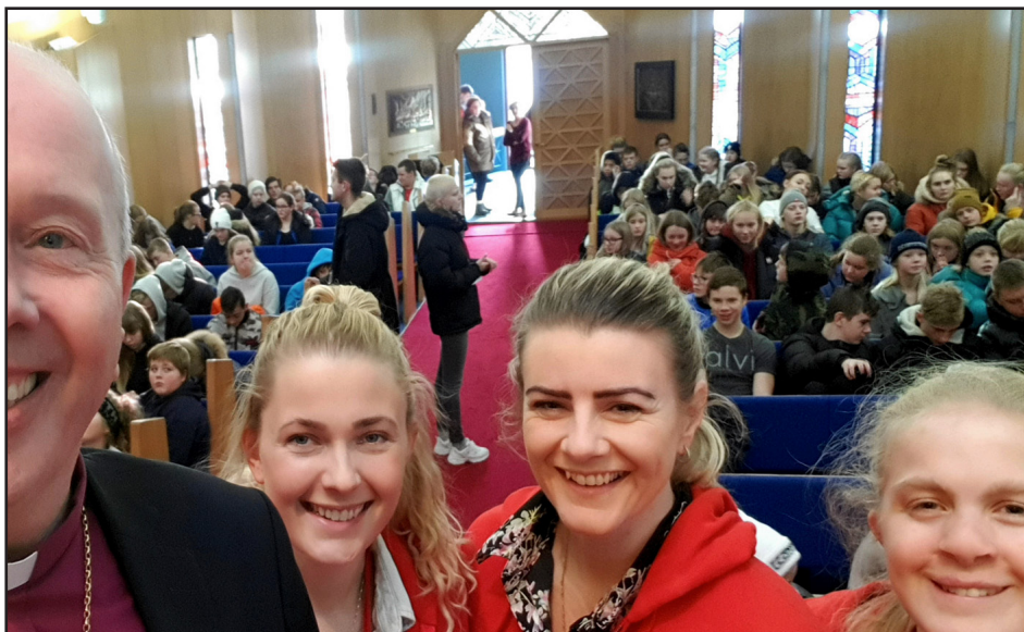
Guðspjónustan að hefjast á landsmóti æskulýðsfélaga í Ólafsvíkirkirkju