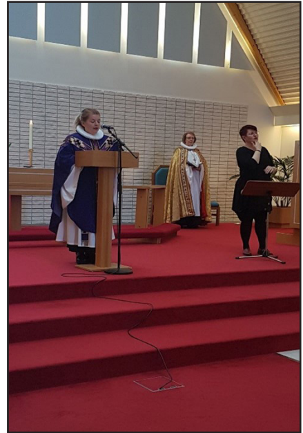
Guðsþjónusta hjá Kirkju heyrnarlausra í Grensáskirkju