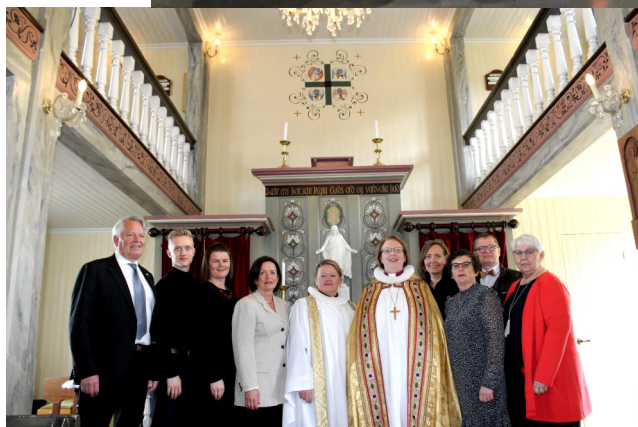
Efri mynd: Kór Ísafjarðarkirkju eftir aðventukvöld 2019