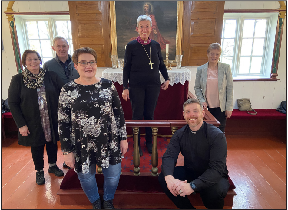
Visitasia í Hálskirkju