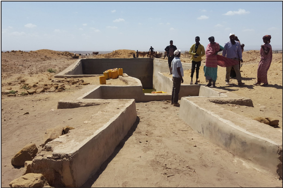
Vatnspró í Eþíópíu.

Sýrland: Markmiðið er að létta á afleiðingum átaka í Sýrlandi, draga úr varnaleyssi, auka öryggi og möguleika á betri lífsafkomu. Bæta velferð barna. Markhópurinn er 1.500 manns.