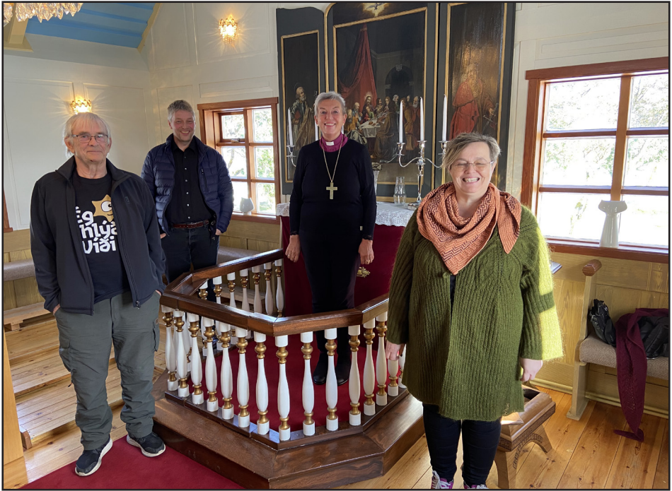
Visitasia í Skútustaðakirkju

öðrum starfandi biskupum. Auka prófastafundur var haldinn á zoom þann 15. apríl og var það fyrirkomulag til fyrirmyndar.