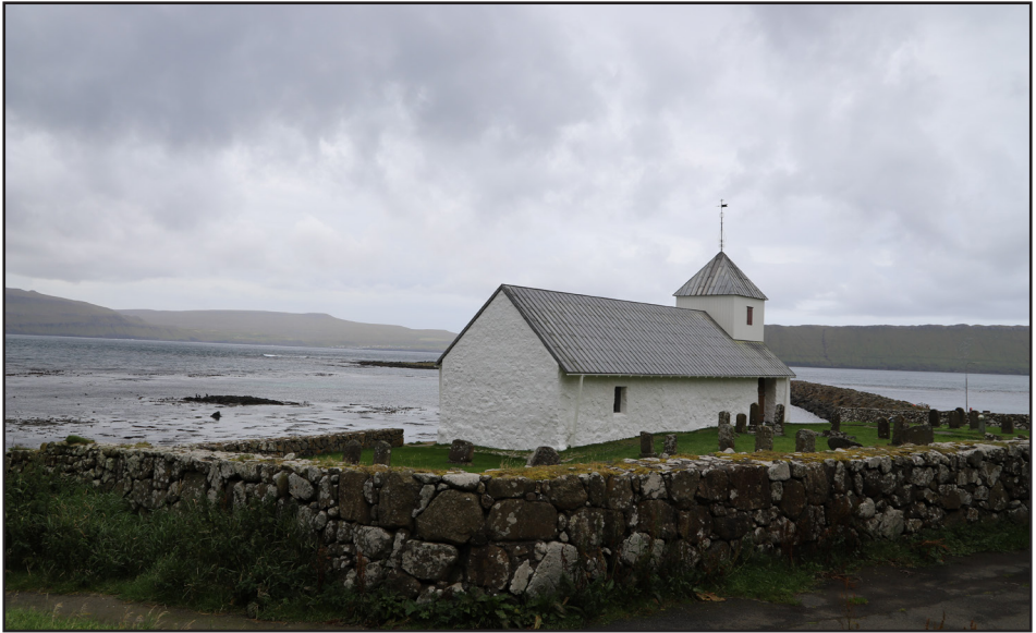
Kirkjubær í Færeyjum – kirkja og garður

hlöðnum grjóttvegg. Lundur Lundarreykjadal : endurnýja hellulagða aðkomu að kirkju og garði. Stafholt í Borgarfirði : ljúka við að endurnýja timburgirðingu umhverfis þrjár hliðar garðsins. Ingjaldshóll : endurnýja hluta af gömlum steiptum vegg á austurhlið kirkjugarðsins. Snóksdalur : greiða niður skuldir við kirkjuna. Sauðafell í Dölum : hlaða upp vesturhlið kirkjugarðsins. Hjarðarholt í Dölum : greiða niður bankaskuldir vegna framkvæmda við garðinn. Reykhólar : ljúka uppsetning girðingar og bæta aðgengi að garðinum. Staður Steingrímsfirði : hefja endurnýjun á umgjörð kirkjugarðs. Blönduós : lagfæra steiptan vegg sem umlykur kirkjugarðinn. Tjörn í Svarfaðardal : endurnýja girðingu og stækka kirkjugarðinn. Möðruvellir Hörgárdal : endurnýja girðingu á framhlið kirkjugarðsins. Akureyri : bæta við og endurnýja lýsingu í garðinum. Munkaþverá : stækka garðinn og endurnýja girðingu á vestur- og norðurhlið. Svalbarðseyri Svalbarðsströnd : greiða niður skuldir. Á árinu var unnið við umhirðu og lagfæringar á nokkrum niðurlögðum gördum eins og Arnarbæli í Ölfusi , Hvoli í Saurbæ , Skálmanesmúla , Selárdal , Stað í Grunnavík . Að lokum má geta þess að Kirkjugarðasamband Íslands fékk styrk samkvæmt þjónustusamningi við Kirkjugarðaráð og áframhaldandi vinnu við gagnagrunninn gardur.is og til að sinna fræðslu og félagsmálum kirkjugarða.