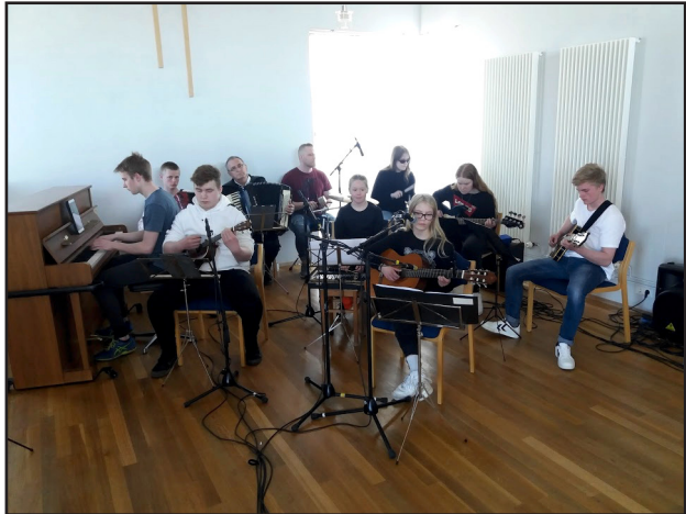
Upptaka vortónleika tónlistarskóla Skagafjarðar í Kófinu

Óhætt er að segja að okkur hafi hlakkað til í byrjun árs 2020. Vel leit út með bókanir og í raun komin mikil festa í starfið auk nokkurra spennandi hugmynda sem voru í gangi. En ekki var langt farið sögu þegar ljóst varð að Kófið myndi hafa verulega áhrif á allt hér enda stór hluti okkar gesta fólk í áhættuhópum. Í raun má segja að engin starfsemi hafi verið í gangi eftir 1. mars 2020 þegar áhrifanna tók að gæta verulega. Hafði slíkt ástand mikil áhrif á reksturinn þar sem stofnun sem Langamýri gat ekki nýtt sér þau úrræði sem ríkisstjórnin bauð uppá nema minnkað starfshlutfall eins starfsmanns, en ekki t.d. tekjufallsstyrkina. Því var gengið á eigið fé til að brúa bil sem ekki er enn ljóst hve verður breitt.