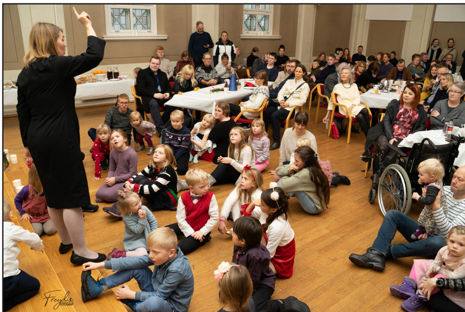
Aðventuhátíðin 2019 fór fram með aðeins öðru sniði en áður hefur tíðkast, með opnu húsi yfir lengri tíma, sögustund fyrir börn (og fullorðna), og fjölbreyttum tónlistaratriðum. Húsfyllir var í Uranienborg Menighetshus og mikil ánægja með aðventuhátíðina.

guðsþjónustur og viðburði í Ósló, Kór Kjartans í Þrándheimi og Sönghópurinn Björgvin í Bergen. Gróa Hreinsdóttir organisti fær sérstakar þakkir fyrir sitt framlag.