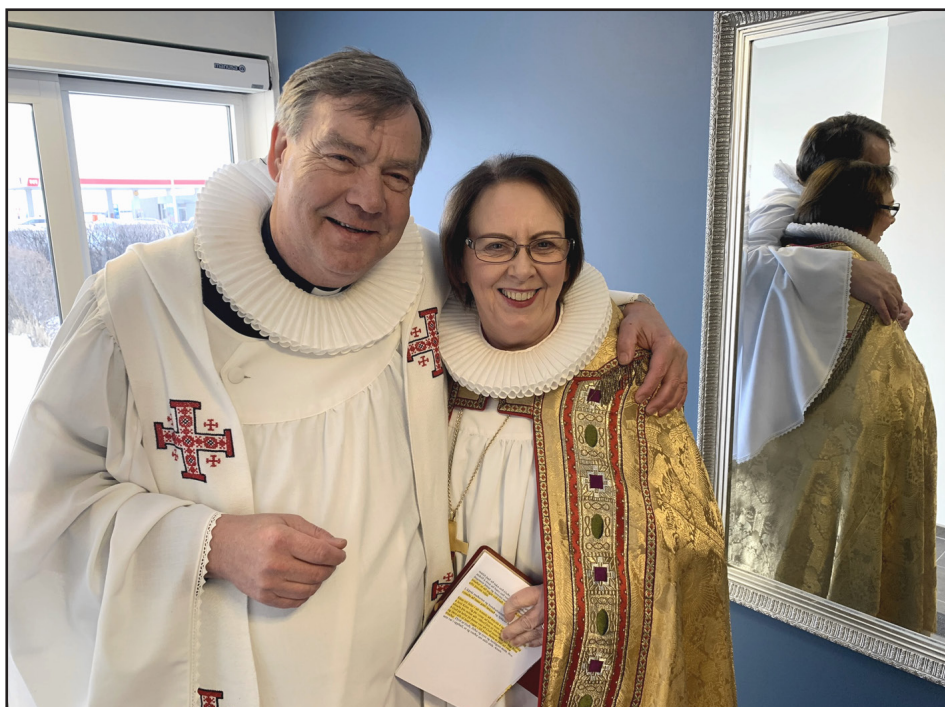
Prófastur og biskup á góðri stundu í vísitásiu biskups

En það var ekki aðeins dagskrá vísitásiunnar sem fór úr skorðum. Líkt og um land allt hafði farsóttin þau áhrif að messuhald lagðist af, fermingum var frestað og útfarir gerðar nánast í kyrrþey. Við þessu var brugðist víða með því að streyma guðsþjónustum, helgistundum og hugleiðingum á heimasíðum kirkna eða á Facebook. Það framtak mæltist vel fyrir. Útfarir voru líka sendar út á netinu.