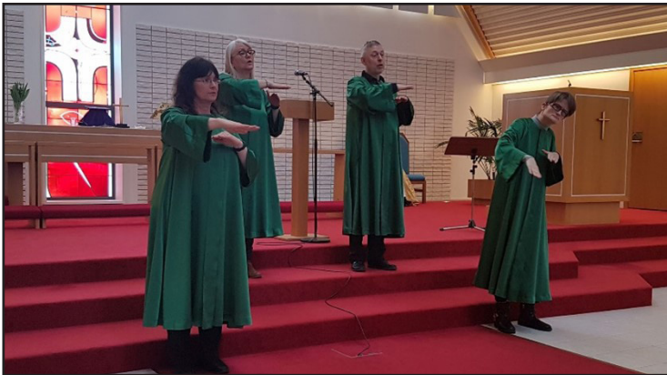
Táknmálskór Kirkju heyrnarlausra syngur á táknmáli

mörg heyrnarskert/ heyrnarlaus börn eða CODA börn (CODA er skammstöfun fyrir Children Of Deaf Adults , þ.e.a.s. börn heyrnarlausra foreldra) eru á fermingaráldri. Flest Döff börn á höfuðborgarsvæðinu ganga í Hlíðaskóla og mörg þeirra velja að fá fræðslu og fermast með sínum bekkjarsystkinum. Döff börn í öðrum skólum fermast í flestum tilfellum með sínum bekkjum en ef óskað er eftir því, kemur prestur heyrnarlausra að fræðslu þeirra barna sem þetta vilja, í samstarfi við sóknarpresta. Góð og mikil samvinna er við Félag heyrnarlausra, sem er öflugt hagsmunafélag og veitir hvers konar ráðgjöf er snúa að málefnum heyrnarlausra. Heimasíða þeirra er www.deaf.is . Prestur heyrnarlausra fer reglulega á skrifstofu félagsins og hefur einnig mætt á opið hús á föstudögum. Þrátt fyrir að mikil breyting hafi orðið á málefnum heyrnarlausra síðustu árin, gerast hlutirnir allt of hægt. Allt of langt er í land enn svo heyrnarlausir njóti sömu mannréttinda og heyrandi einstaklingar hér á landi. Þjóðkirkjan þarf áfram að vera í forystu með að sýna og vinna að jöfnum rétti heyrnarlausra og heyrandi og því er svo mikilvægt að hlúð sé að Kirkju heyrnarlausra og söfnuði hennar.