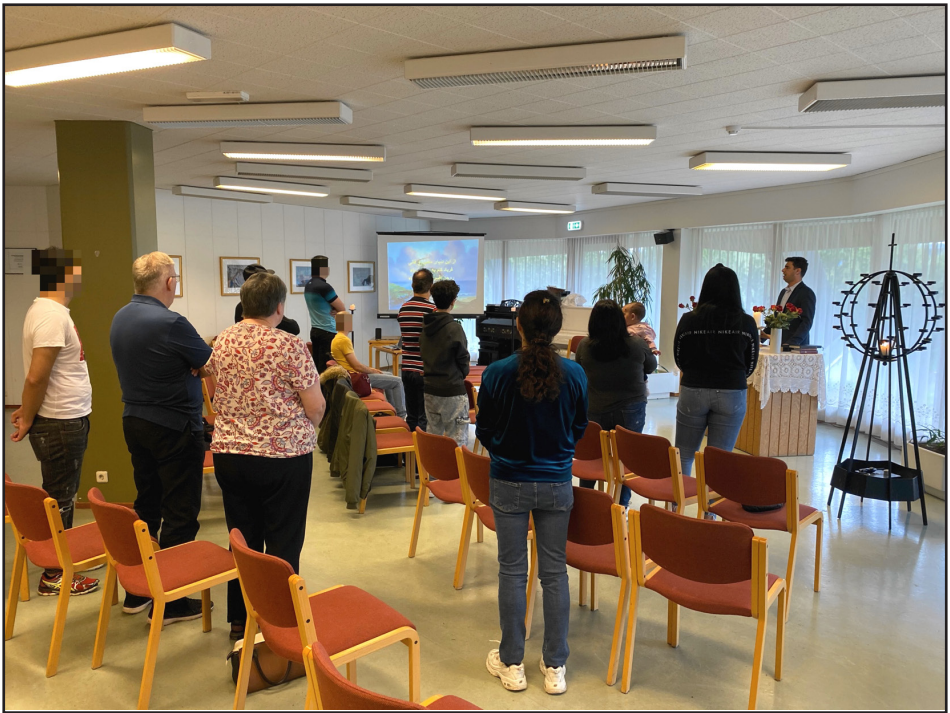
Lofgjörðarsamkoma á farsí í júní 2020

og framkvæmd. 7-10 manns mættu í hvert skipti. Það var afar leiðinlegt að þessi tilraun var stöðvuð vegna Covid mála.