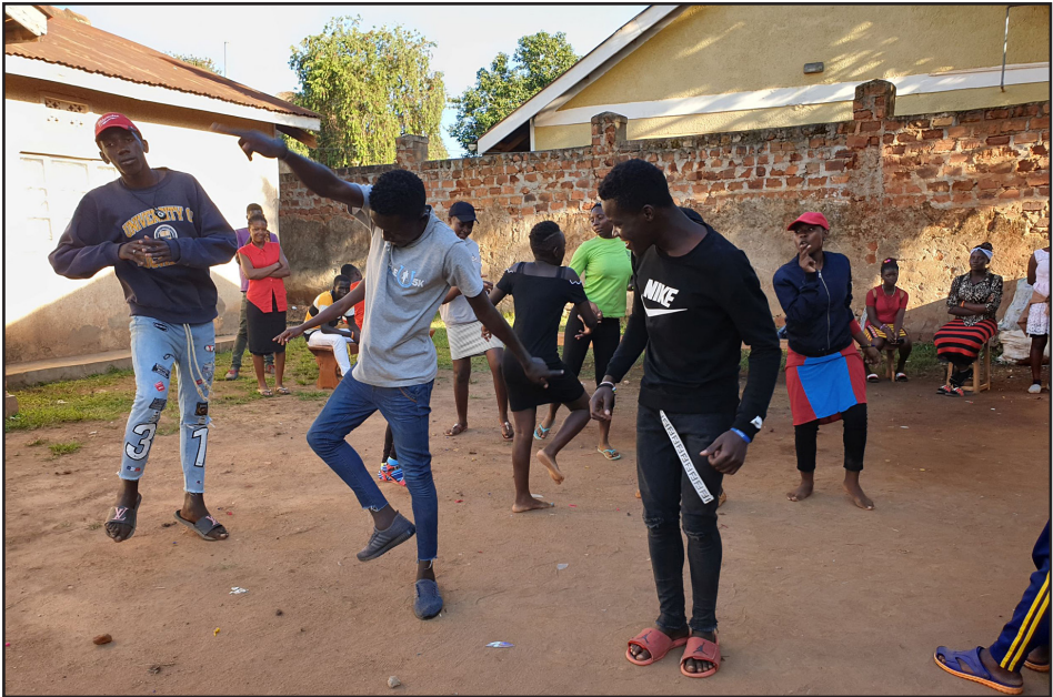
Dansað í verkmenntamiðstöð í Kampala í Úganda.

við Lútherska heimssambandið í Eþíópíu með dyggum stuðningi frá einstaklingum og utanríkisráðuneytinu síðan árið 2007 eða í 13 ár.