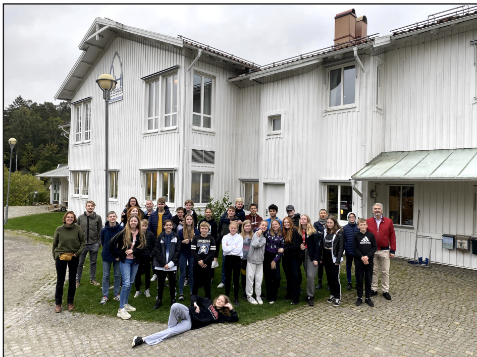
Frá fermingarmóti 2020