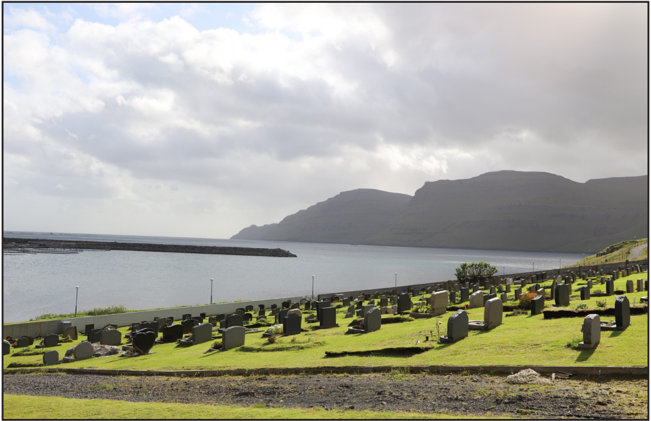
Gata – nýi garðurinn