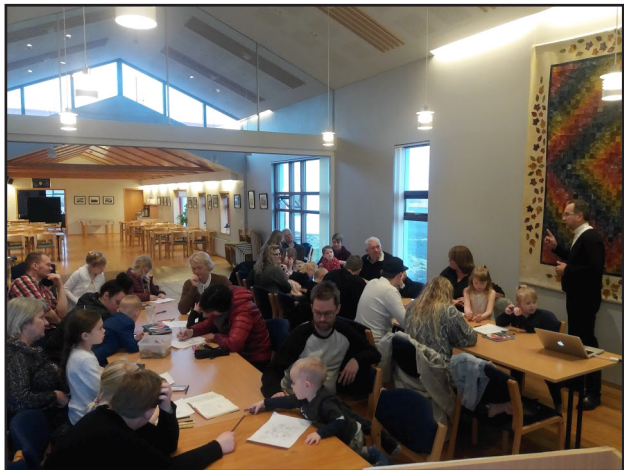
Fjölmenni í sunnudagaskólanum