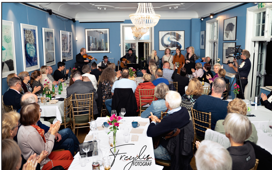
Fjöldi íslenskra tónlistarmanna kom fram á vel heppnuðum tónleikum í Sjöholmen og uppselt var á tónleikana.