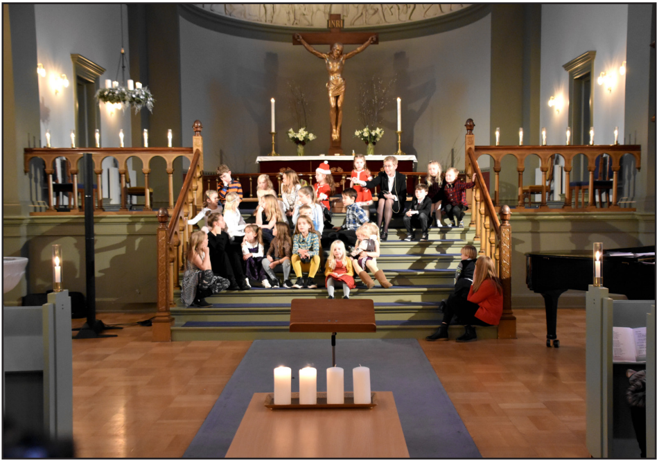
Barnastund á aðventuhátíð

Afar ánægjulegt er að vinna með sóknarnefndinni í Gautaborg er gengur af alúð í öll störf sem unnin eru.