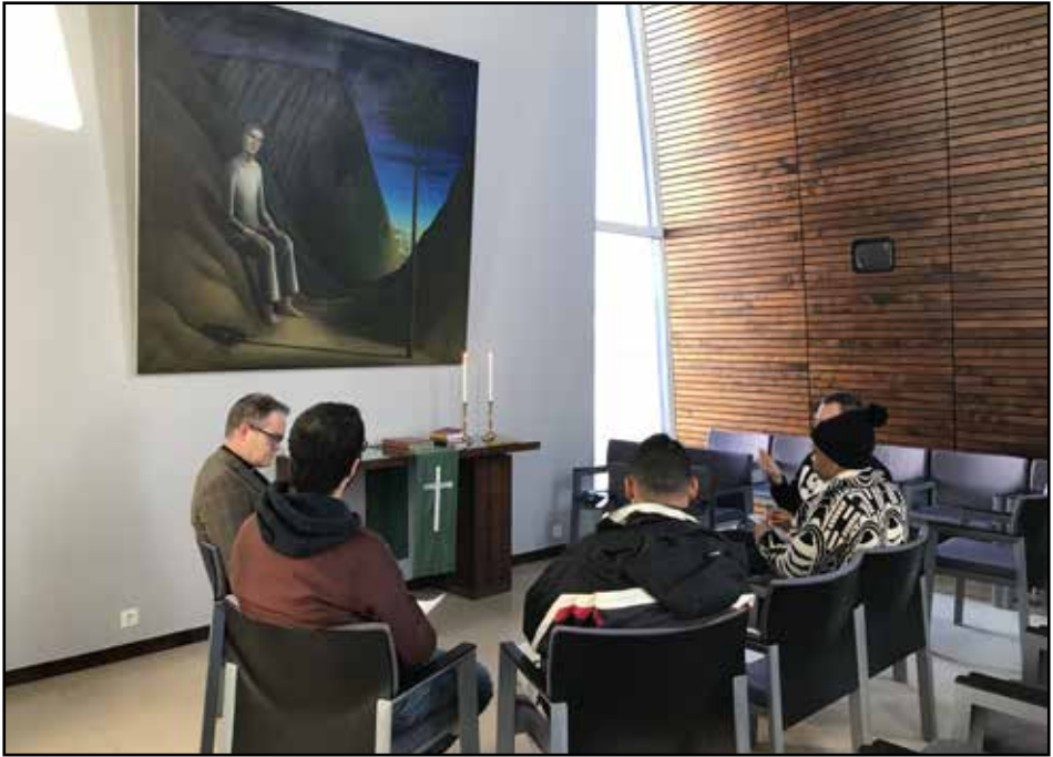
Frá bænasamkomu í Keflavíkurkirkju