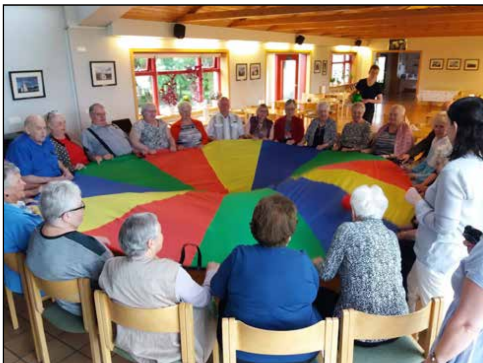
Fjör í morgunleikfiminna hjá eldri borgurum

fyrir starfi eldri borgara og Lionsklúbbur Skagafjarðar hefur sitt varnarþing hér svo dæmi séu tekin. Hér verða ekki tíundaðir námskeið, fundir og mannfagnaðir og fjölmargt annað sem fær innhlaup rekist það ekki á annað sem er í gangi.