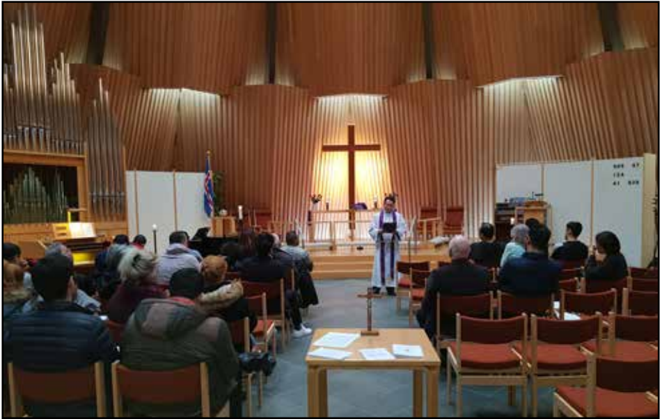
Messa í Breiðholtsskirkju

einstaklings. En þegar það telst betra fyrir þátttakanda vegna tungumálaerfiðleika eða annars er hún einnig haldin í hópkenndu.