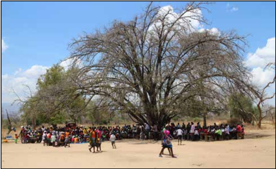
Starfið í Keníu nær nokkuð inn fyrir landamæri Úganda. Nokkrir söfnuðir komu saman á sunnudegi um 400 manns undir tré til að lofa Drottin og tilbiðja.

Starf Kristniboðssambandsins (SÍK) teygir sig víða, bæði innanlands og á erlendri grundu. Víða eru tækifæri til að boða fagnaðarerindið um kærleika Guðs í Jesú Kristi og til að mæta fólki með margvíslegri kærleikspjónustu kristniboða og samstarfsaðila SÍK. Markmið SÍK er að sinna kristinni boðun og kærleikspjónustu meðal heiðinna þjóða, ekki síst með því að mennta og senda kristniboða til starfa. Kristniboðssambandið vinnur einnig að kynningarstarfi, vitundarvakningu og boðun hér á landi m.a. í samstarfi við margar sóknir landsins. Kristniboðssambandið er sjálfstæð samtök sem starfa innan þjóðkirkjunnar á kenningargrundvelli evangelískrar lúterskrar kirkju.