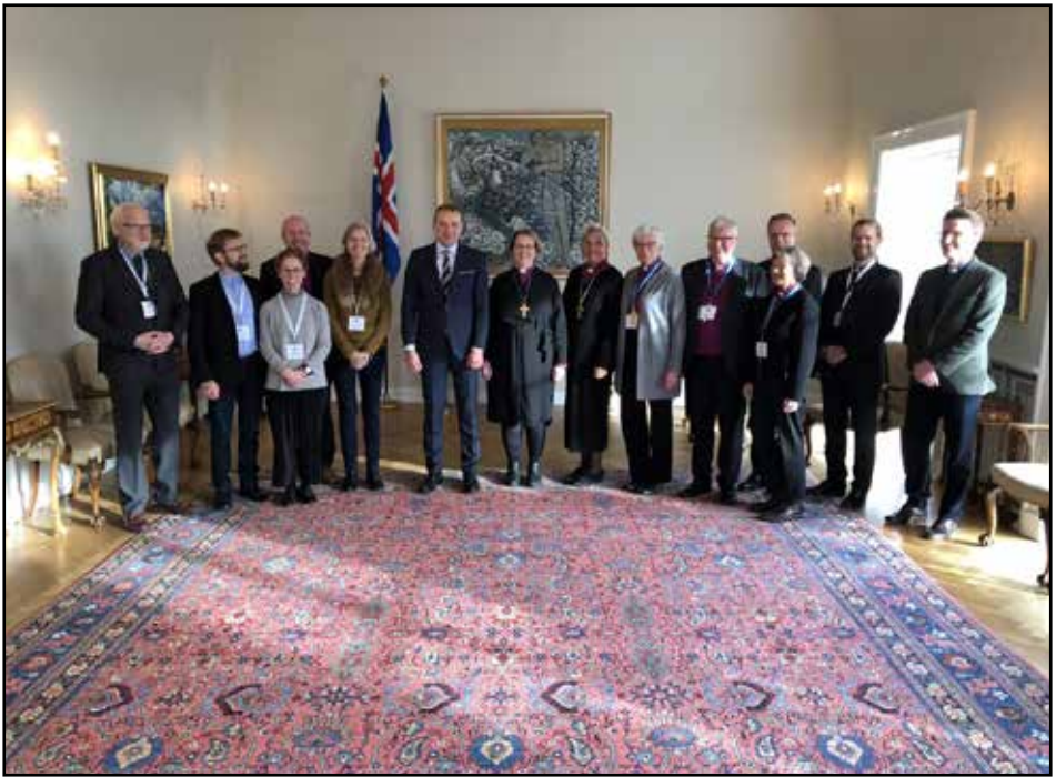
Biskupar Norðurlanda á Bessastöðum

Hann er við því búinn að stuðla að því, að innan Háskólans verði til alþjóðlegt menntasetur á umhverfisverndarsviði, sem styrki stöðu Íslands sem forysturíkis í þessum mikilvæga málaflokki. Ráðstefna Alkirkjuráðsins, WCC, um réttlátan frið við jörðu og þátttaka þess í 5. Hringborði Norðurslóða, svo og Íslandsheimsókn Patriarkans, var mikilvægt framlag þjóðkirkjunnar til 500 ára minningarársins um trúarsíðbót Marteins Lúthers. Þessir viðburðir miðuðu að þeirri þörfu síðbót í samtíðinni að samræma stefnu kristinna kirkna í umhverfismálum og virkja þær enn betur en verið hefur til lífs- og umhverfisverndar.