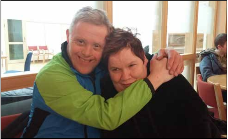
Frá starfinu í Grensáskirkju

virka oft of flókin. Mikilvægt er að prestar og starfsfólk kirkjunnar bjóði líka fólki með fötlun þátttöku í helgihaldi kirkjunnar s.s. messuhópum og þar með velti því um leið fyrir sér hvernig kirkjan getur nálgast betur fólk með þroskahömlun. Ég hef bent á ýmsar leiðir í þeim efnum, eins og að bjóða fólki með þroskahömlun að taka þátt í samtali um messuna. Að þau taki þátt í messuhópum t.d. með því að lesa léttu texta, bjóða fólk velkomið, útteila sálmabókum eða tendra ljós í upphafi samveru.