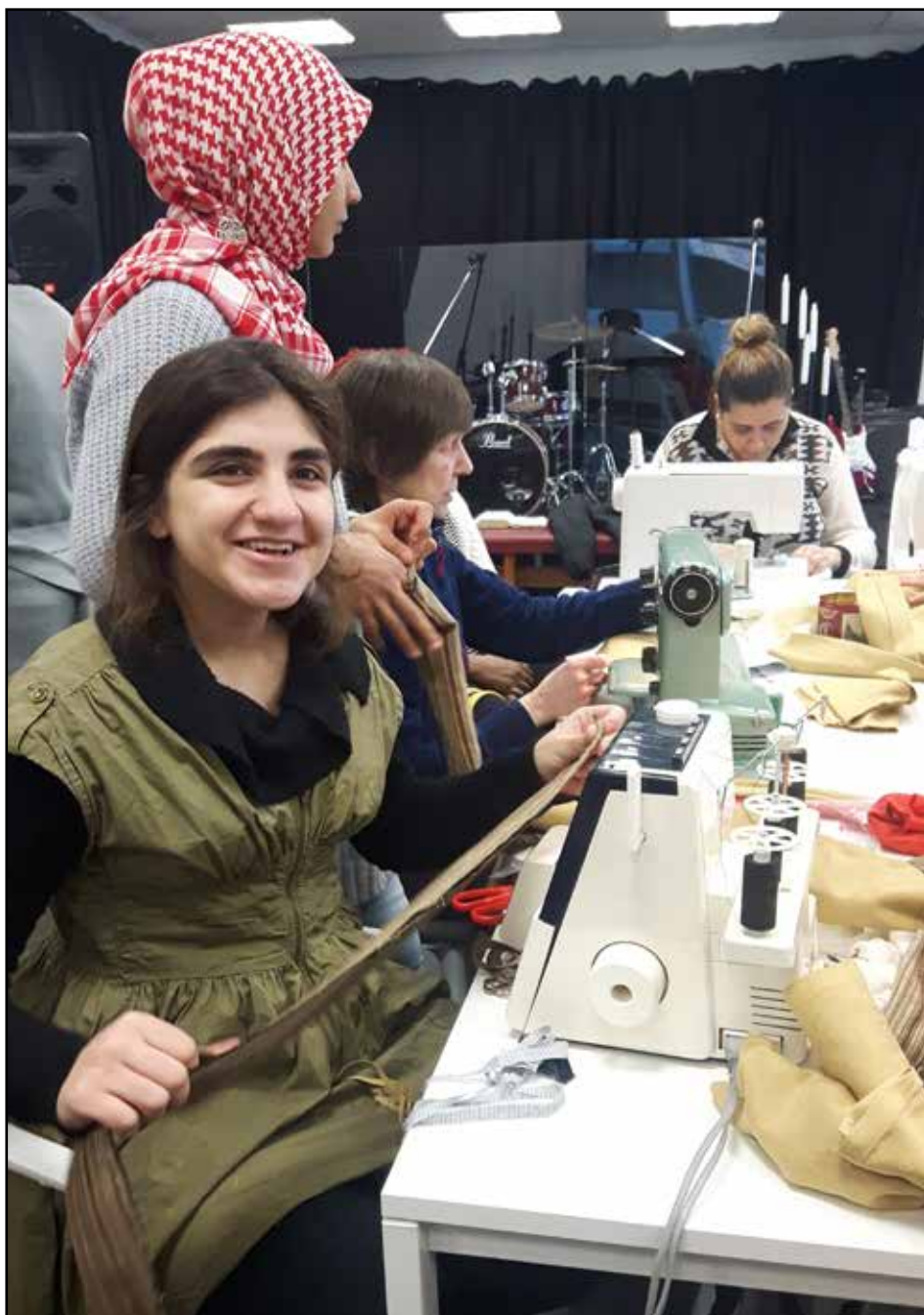
Á hverjum mánudegi hittast konur úr hópi innflytjenda, flóttafólks og hælisleitenda til að sauma saman fjölnota innkaupatóskur og grænmetispoka auk þess sem þær borða saman hádegismat. Konurnar koma víða að og hafa ólíkan bakgunn