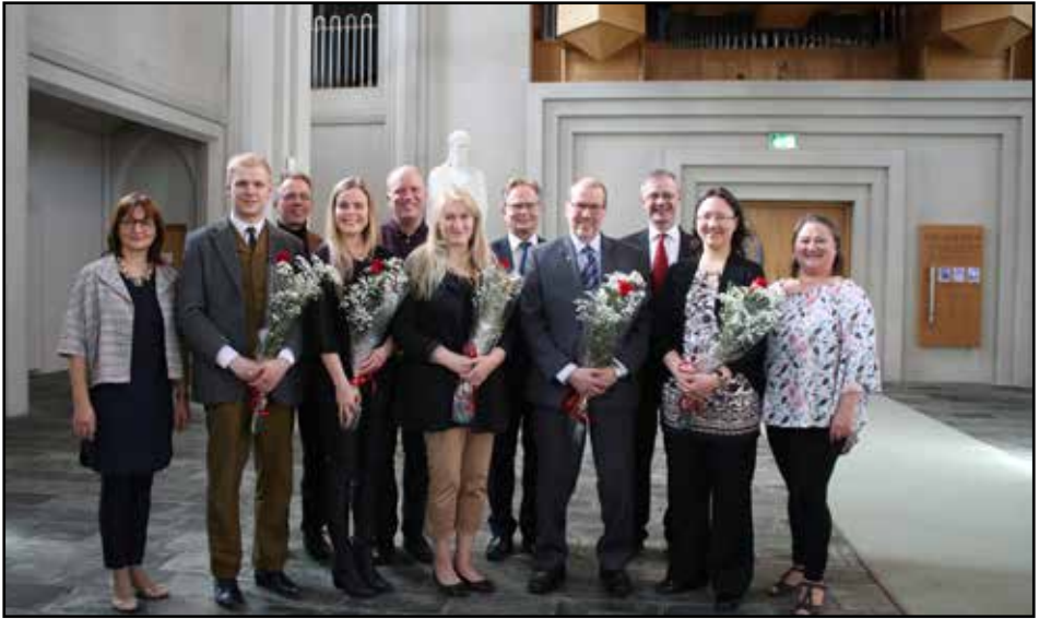
Útskrifarhópur Tónskólans vorið 2018 ásamt starfslíði