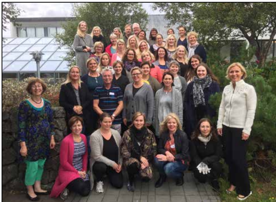
Frá kórstjórasmveru í Skálholti