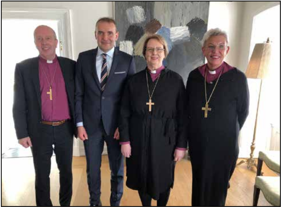
Biskupar Íslands með forseta Íslands

einnig annarra forystumanna Rétttrúnaðarkirkjunnar. Hann þakkaði það að patriarkinn hefði fengið tækifæri til að ávarpa Hringborð Norðurslóða í Silfurbergi og einnig WCC málstofu á vegum þess og mjög vingjarnlegar og höfðinglegar móttökur hér á landi. Þeim þyki báðum mikils um vert, að þjóðkirkjan hafi boðið þeim að flytja Rétttrúnaðarmessu, Divine Liturgy , í Hallgrímskirkju og taka þar jafnframt þátt í samkirkjulegri guðspjónustu.