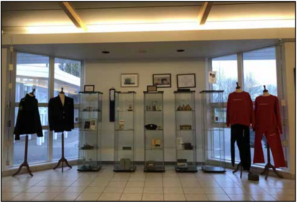
Drög að Fangelsismínjasafni Íslands - frá sýningu í Grensáskirkju í maí s.l.

sem hafa forystu í málefnum fangelsa og fanga að koma að málum svo merk saga glatist ekki. Of lengi hefur verið sofið á verðinum.