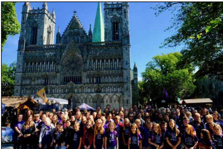
Unglingakór Hafnarfjarðarkirkju fyrir utan dómkirkjuna í Niðarósi

með það að markmiði að gera fræðsluefni fyrir aðstandendur. Því næst óskaði ég eftir að í starfshópnum sætu auk mín formaður Kirkjutónlistarráðs og fulltrúar PÍ og FÍO.