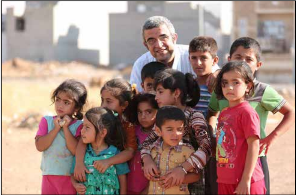
Fjöldi barna nýtur góðs af Sat7 Akademy, skólasjónvarpi Sat7 þar sem kennd er arabíska, enska, reikningur og fleira.

Kristniboðssambandið er að öðru leyti í sambandi við nokkra erlenda aðila sem tengjast starfi þess á alþjóðavettvangi, bæði önnur kristniboðssamtök og regnhlífarsamtök um kristniboð.