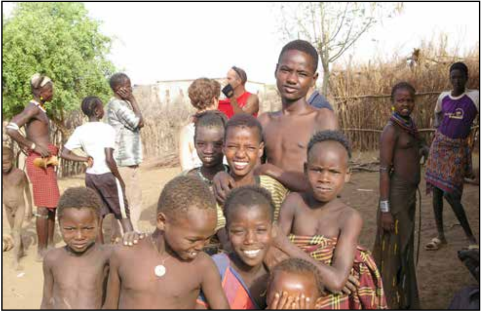
Frá Ómó Rate í Eþíópíu

SÍK er í góðu samstarfi við ýmsa aðila innanlands á sviði kirkju, samkirkjumála og þróunarsamvinnu. Eins hafa starfsmenn sinnt dagskrárgerð á útvarpsstöðinni Lindinni.